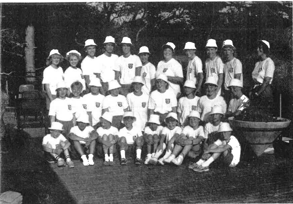
Korpset i sommeruniformer på jubileumstur til Korcula sommeren 1987.